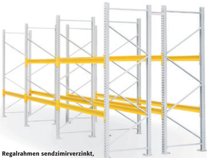
Regalrahmen sendzimirverzinkt, Standardfarbe Traverse lichtgrau RAL 7035